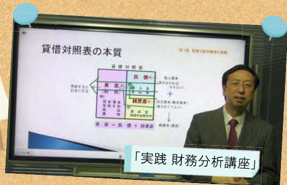
「実践 財務分析講座」